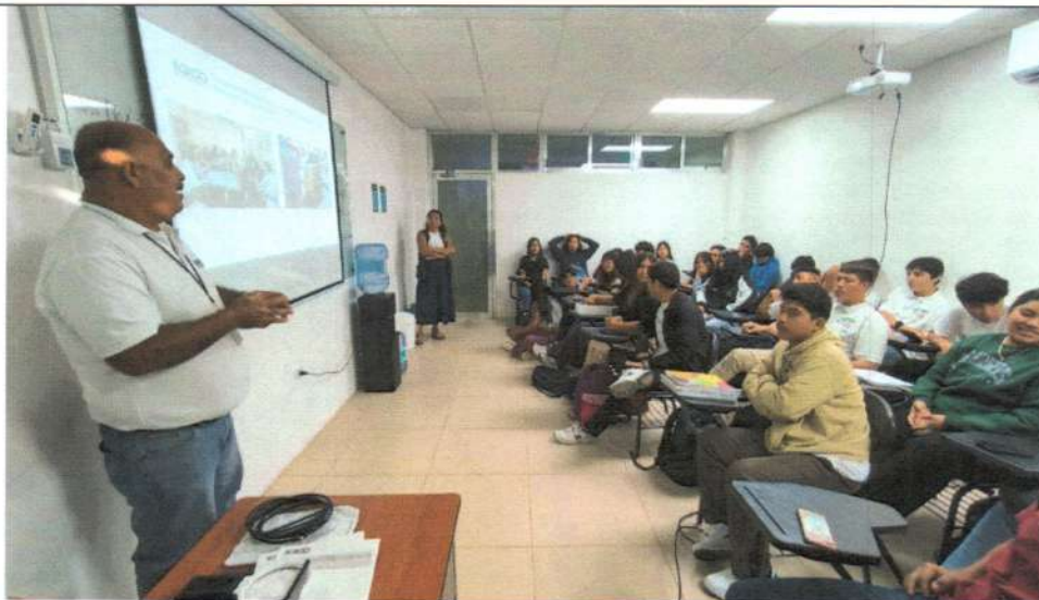
Pláticas de socialización de las actividades de organización electoral al Ayuntamiento de Tulum