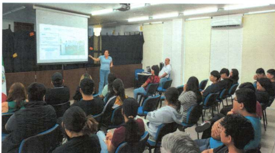
Pláticas de socialización de las actividades de organización electoral la Universidad Tecnológica de Tulum