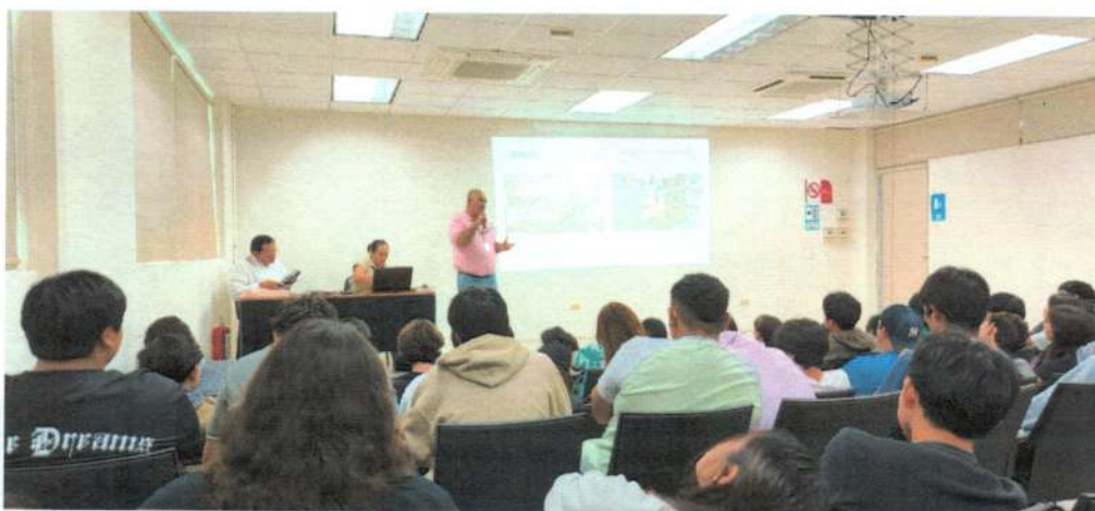
Pláticas de socialización de las actividades de organización electoral en la Universidad Interamericana para el Desarrollo, campus Playa del Carmen